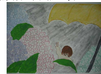
【美術部制作カレンダーより】